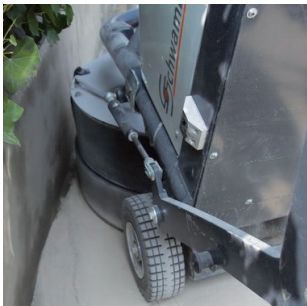
Randnahes Schleifen mit der Fernsteuerung