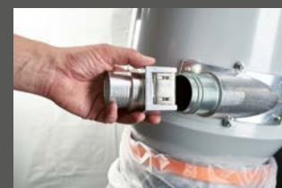
С помощью системы щелчка для крепления всасывающего шланга

Серийно с предварительным фильтром (моющимся) и HEPA-фильтром. Очистка фильтра производится реактивным импульсом. Стрехступенчатой фильтрацией пыли: 1-я ступень для крупной пыли, 2-я ступень с тонкостью очистки 99,9 % через предварительный фильтр из полиэстера, 3-я ступень через 2 x HEPA-фильтра с тонкостью очистки 99.995%. Сбор пыли осуществляется в прозрачный и легко транспортируемый полимерный мешок (Longbag).