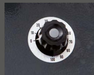
С регулированием числа оборотов