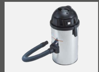
Option mit Staubsauger SDC 120