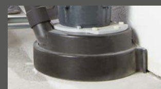
Шлифование от самого края

Шлифование бетона, стяжки, асфальта и полов из натурального камня. Удаление слоев и подготовка основания.