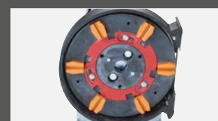
Унифицированная система расходного инструмента, подходящая для всех моделей