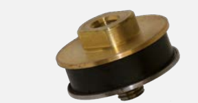
Резиновая соединительная муфта, эластичная, М 14