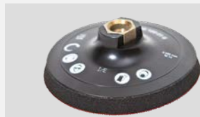
Опорная тарелка, застежка-липучка, на резиновой основе, М 14, Ø 123 mm